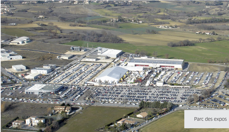
Parc des expos