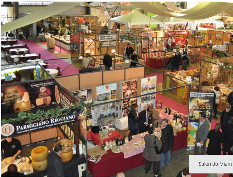
Salon du Miam